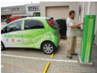
Stanice pro elektromobily