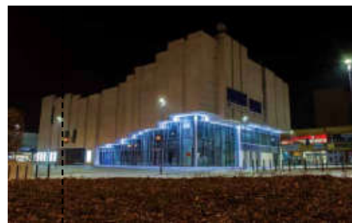
Rekonstruované kino Centrum