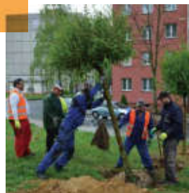
Výsadba nové zeleně