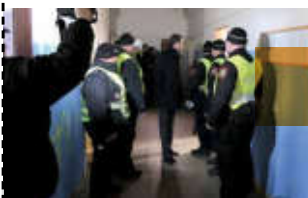
Zrušili jsme ubytovnu Mašinka na nádraží