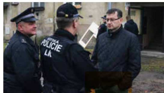
Kontrola v Karviné 6