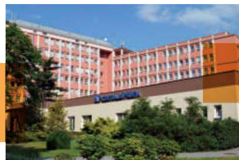
Každoroční dotace do obou karvinských nemocnic