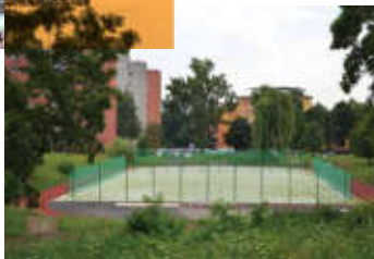
Školní hřiště otevřená veřejnosti