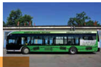
Ekologický provoz MHD