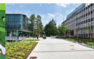
Nové okolí magistrátu