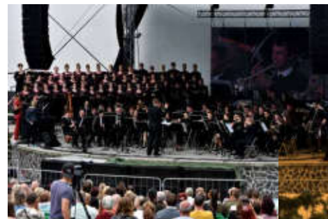
Koncert Májováku a Permoniku