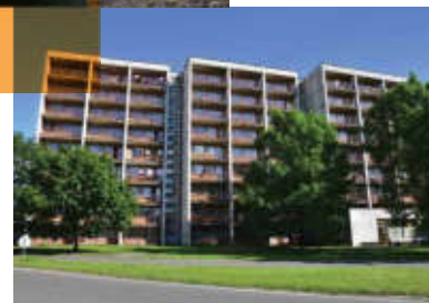
Zrušili jsme ubytovnu Kosmos