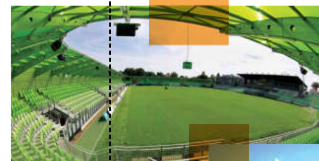
Prvoligový fotbalový stadion