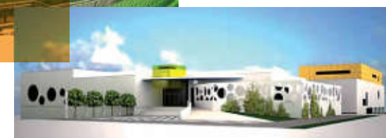
Vizualizace nového krytého bazénu s wellness